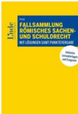
Fallsammlung Römisches Sachen- und Schuldrecht Ladenpreis: 38,00EUR