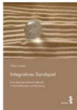
Integratives Sandspiel Ladenpreis: 21,90EUR