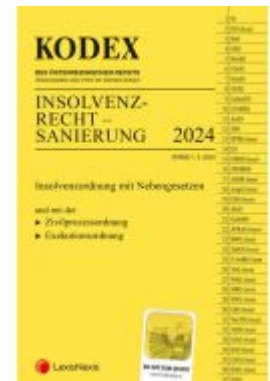
KODEX Insolvenzrecht - Sanierung 2024 - inkl. App Ladenpreis: 37,00EUR