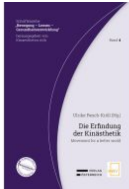
Die Erfindung der Kinästhetik Ladenpreis: 39,00EUR