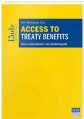
Access to Treaty Benefits Ladenpreis: 98,00EUR