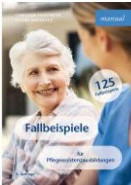
Fallbeispiele für Pflegeassistenzausbildungen Ladenpreis: 24,90EUR