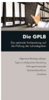
Die GPLB Ladenpreis: 14,30EUR