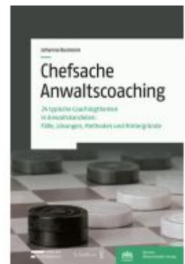
Chefsache Anwaltscoaching Ladenpreis: 83,00EUR