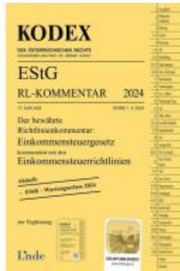
KODEX EStG Richtlinien-Kommentar 2024 Ladenpreis: 74,00EUR