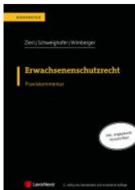
Erwachsenenschutzrecht Ladenpreis: 129,00EUR