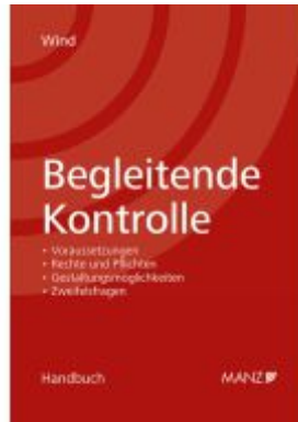
Begleitende Kontrolle Ladenpreis: 94,00EUR