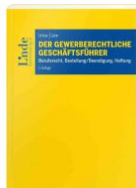
Der gewerberechtliche Geschäftsführer Ladenpreis: 49,00EUR