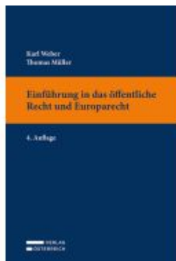
Einführung in das öffentliche Recht und Europarecht Ladenpreis: 24,00EUR

Wir haben andere Produkte gefunden, die Ihnen gefallen könnten!