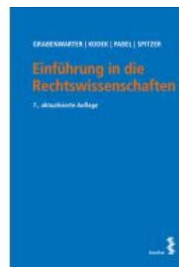
Einführung in die Rechtswissenschaften Ladenpreis: 22,00EUR