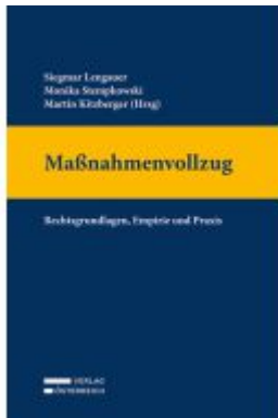
Maßnahmenvollzug Ladenpreis: 119,00EUR