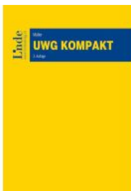
UWG kompakt Ladenpreis: 59,00EUR