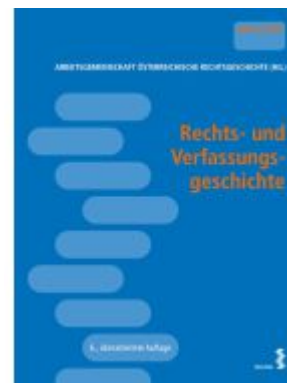
Rechts- und Verfassungsgeschichte Ladenpreis: 44,00EUR