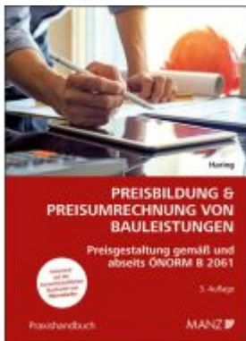
Preisbildung & Preisumrechnung von Bauleistungen Ladenpreis: 52,00EUR