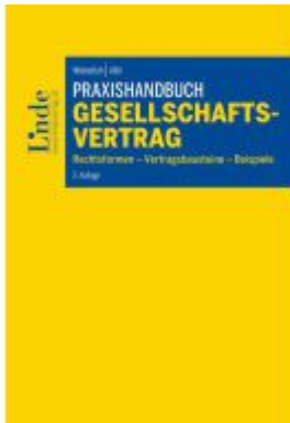
Praxishandbuch Gesellschaftsvertrag Ladenpreis: 74,00EUR