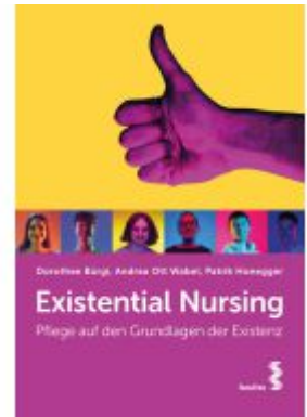
Existential Nursing Ladenpreis: 24,90EUR