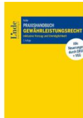
Praxishandbuch Gewährleistungsrecht Ladenpreis: 49,00EUR