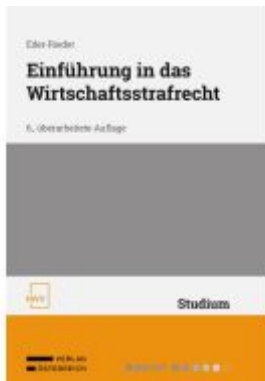
Einführung in das Wirtschaftsstrafrecht Ladenpreis: 48,00EUR