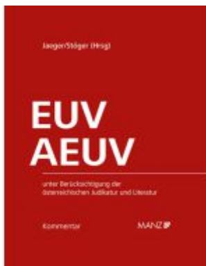
Kommentar zu EUV und AEUV Ladenpreis: 398,00EUR