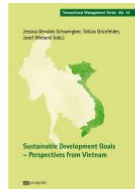
Sustainable Development Goals - Perspectives from Vietnam Ladenpreis: 39,10EUR