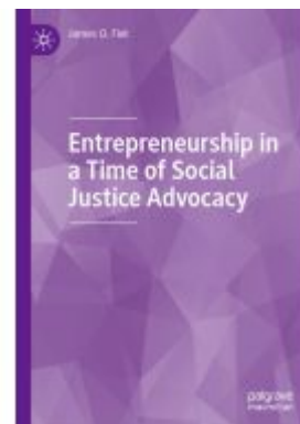
Entrepreneurship in a Time of Social Justice Advocacy