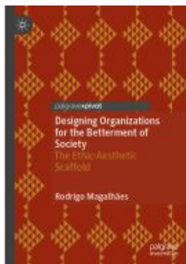
Designing Organizations for the Betterment of Society