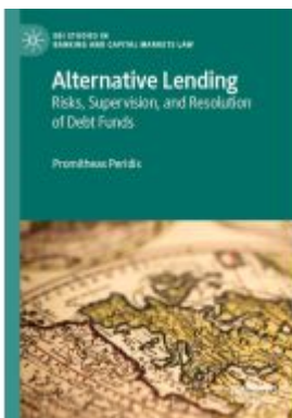
Alternative Lending Ladenpreis: 109,99EUR