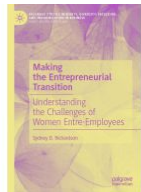
Making the Entrepreneurial Transition Ladenpreis: 164,99EUR