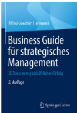
Business Guide für strategisches Management Ladenpreis: 46,25EUR

Wir haben andere Produkte gefunden, die Ihnen gefallen könnten!