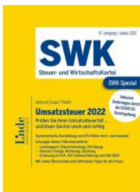
SWK-Spezial Umsatzsteuer 2022 Ladenpreis: 52,00EUR