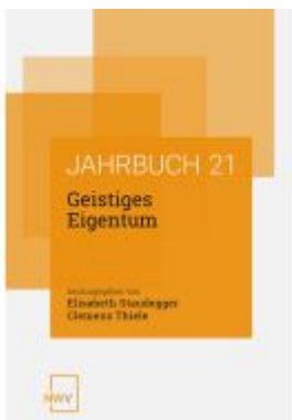
Geistiges Eigentum Ladenpreis: 68,00EUR

Wir haben andere Produkte gefunden, die Ihnen gefallen könnten!