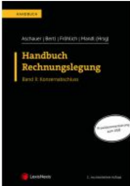
Handbuch Rechnungslegung / Handbuch Rechnungslegung, Band II: Konzernabschluss Ladenpreis: 99,00EUR