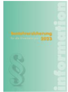
Sozialversicherung 2023 Ladenpreis: 49,50EUR