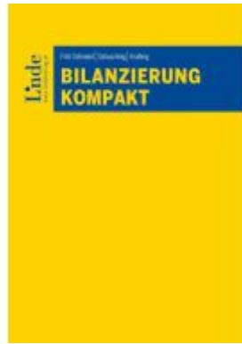
Bilanzierung kompakt Ladenpreis: 55,00EUR