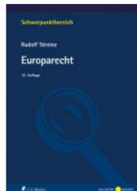
Europarecht Ladenpreis: 28,80EUR