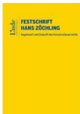
Gegenwart und Zukunft des Konzernsteuerrechts – Festschrift für Hans Zöchling Ladenpreis: 138,00EUR