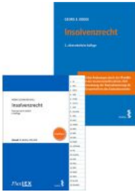
Kombipaket Insolvenzrecht und FLexLex Insolvenzrecht | Studium Ladenpreis: 47,00EUR