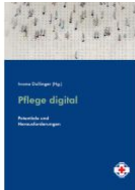
Pflege digital Ladenpreis: 16,90EUR