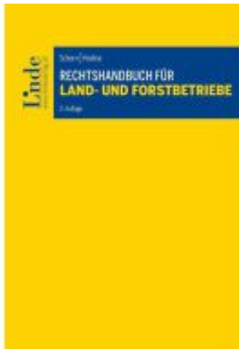
Rechtshandbuch für Land- und Forstbetriebe Ladenpreis: 58,00EUR