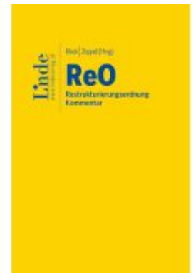
ReO | Restrukturierungsordnung Ladenpreis: 120,00EUR