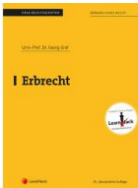
Erbrecht (Skriptum) Ladenpreis: 30,00EUR