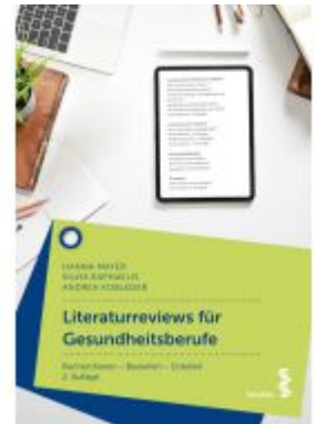
Literaturreviews für Gesundheitsberufe Ladenpreis: 28,90EUR