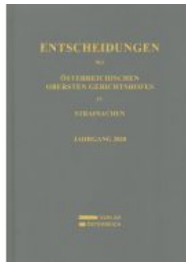
Entscheidungen des Österreichischen Obersten Gerichtshofes in Strafsachen Ladenpreis: 128,00EUR