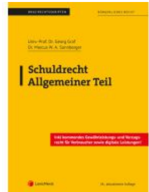
Schuldrecht Allgemeiner Teil (Skriptum) Ladenpreis: 22,50EUR