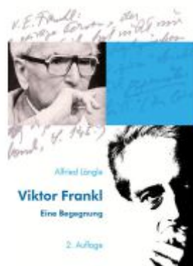
Viktor Frankl Ladenpreis: 19,90EUR