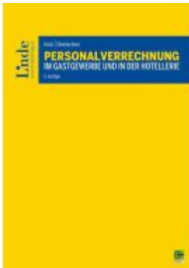
Personalverrechnung im Gastgewerbe und in der Hotellerie Ladenpreis: 60,00EUR