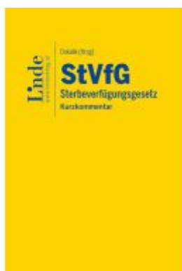
StVfG | Sterbeverfügungsgesetz Ladenpreis: 39,00EUR