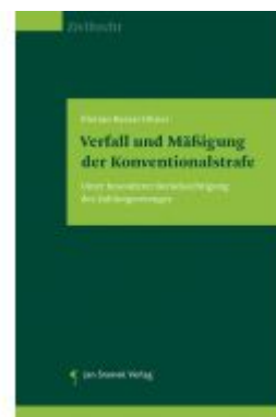
Verfall und Mäßigung der Konventionalstrafe Ladenpreis: 55,00EUR