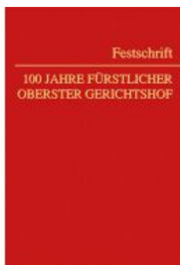
100 Jahre Fürstlicher Oberster Gerichtshof Ladenpreis: 110,00EUR