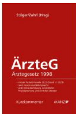
ÄrzteG - Ärztegesetz 1998 Ladenpreis: 175,00EUR