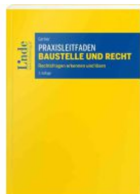
Praxisleitfaden Baustelle und Recht Ladenpreis: 38,00EUR