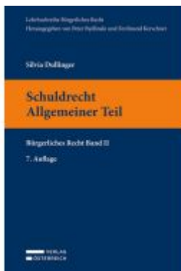
Schuldrecht Allgemeiner Teil Ladenpreis: 28,00EUR