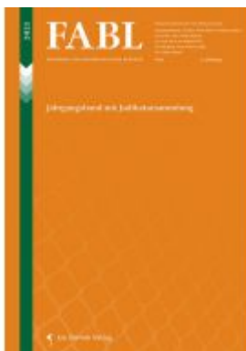
FABL Fremden- und Asylrechtliche Blätter Ladenpreis: 59,90EUR