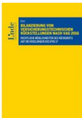
Bilanzierung von versicherungstechnischen Rückstellungen nach VAG 2016 Ladenpreis: 79,00EUR