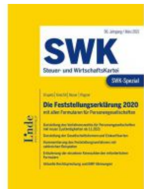
SWK-Spezial Die Feststellungserklärung 2020 Ladenpreis: 48,00EUR