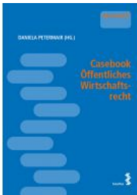
Casebook Öffentliches Wirtschaftsrecht Ladenpreis: 28,00EUR