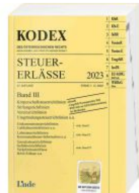
KODEX Steuer-Erlässe 2023, Band III Ladenpreis: 62,00EUR