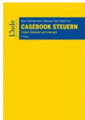
Casebook Steuern Ladenpreis: 72,00EUR