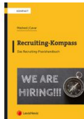
Recruiting-Kompass Ladenpreis: 20,00EUR