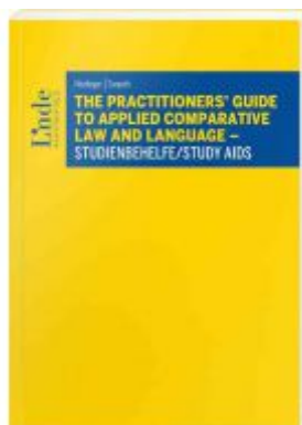
The Practitioners' Guide to Applied Comparative Law and Language – Studienbehelfe/Study Aids Ladenpreis: 49,00EUR