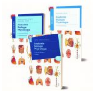
Lernpaket Anatomie, Biologie, Physiologie II Ladenpreis: 66,90EUR