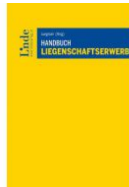
Handbuch Liegenschaftserwerb Ladenpreis: 49,00EUR