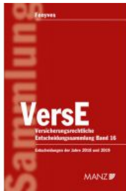
Versicherungsrechtliche Entscheidungssammlung VersE Ladenpreis: 259,00EUR