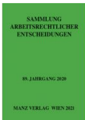
Sammlung arbeitsrechtlicher Entscheidungen Ladenpreis: 96,00EUR