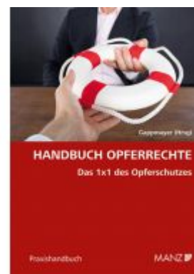
Handbuch Opferrechte Das 1x1 des Opferschutzes Ladenpreis: 48,00EUR