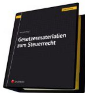
Gesetzesmaterialien zum Steuerrecht Ladenpreis: 160,00EUR