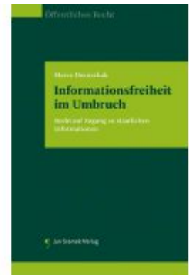
Informationsfreiheit im Umbruch Ladenpreis: 98,00EUR