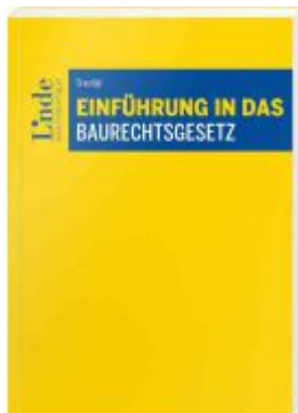
Einführung in das Baurechtsgesetz Ladenpreis: 24,00EUR

Wir haben andere Produkte gefunden, die Ihnen gefallen könnten!