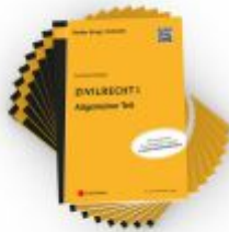
PAKET Lehrbuchreihe Zivilrecht I - VIII