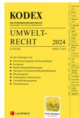
KODEX Umweltrecht 2024 - inkl. App