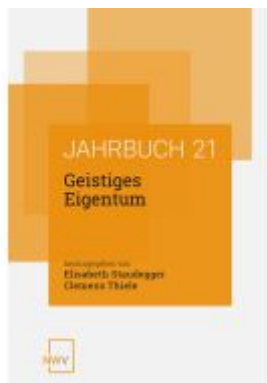
Geistiges Eigentum Ladenpreis: 68,00EUR