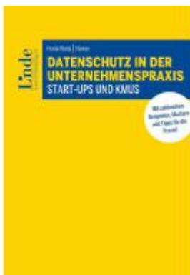
Datenschutz in der Unternehmenspraxis