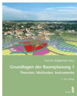
Grundlagen der Raumplanung 1 Ladenpreis: 32,00EUR