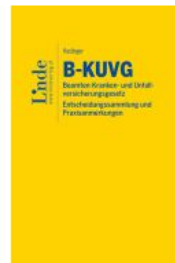
B-KUVG | Beamten-Kranken- und Unfallversicherungsgesetz - Entscheidungssammlung und Praxisanmerkungen Ladenpreis: 89,00EUR