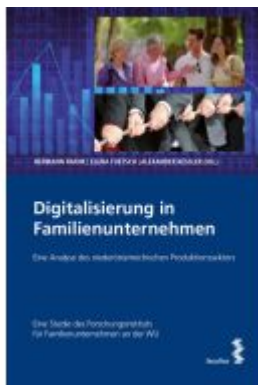
Digitalisierung in Familienunternehmen