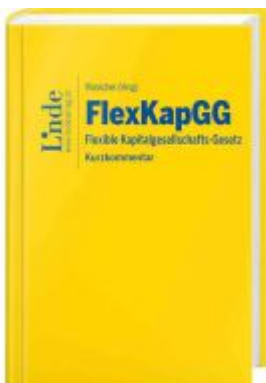
FlexKapGG | Flexible Kapitalgesellschafts-Gesetz

Wir haben andere Produkte gefunden, die Ihnen gefallen könnten!