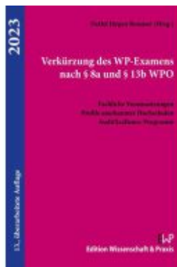
Verkürzung des WP-Examens nach § 8a und § 13b WPO Ladenpreis: 25,60EUR