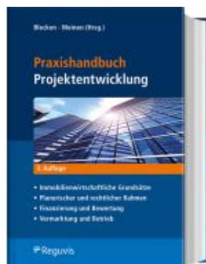
Praxishandbuch Projektentwicklung Ladenpreis: 80,20EUR