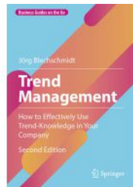
Trend Management Ladenpreis: 43,99EUR