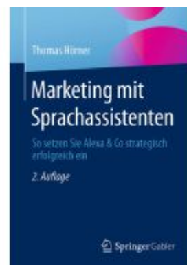
Marketing mit Sprachassistenten Ladenpreis: 56,53EUR