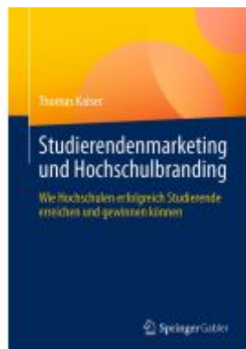
Studierendenmarketing und Hochschulbranding Ladenpreis: 61,67EUR