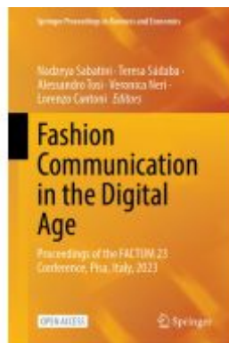
Fashion Communication in the Digital Age Ladenpreis: 54,99EUR