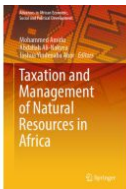
Taxation and Management of Natural Resources in Africa Ladenpreis: 175,99EUR