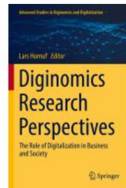
Diginomics Research Perspectives Ladenpreis: 109,99EUR