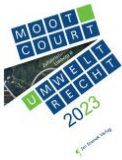
Moot Court - Umweltrecht 2023 Ladenpreis: 55,00EUR