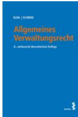
Allgemeines Verwaltungsrecht Ladenpreis: 38,00EUR