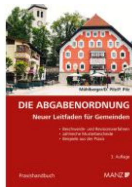
Die Abgabenordnung Neuer Leitfaden für Gemeinden Ladenpreis: 59,00EUR