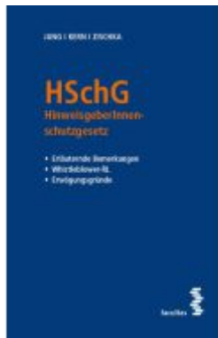
HSChG Ladenpreis: 29,00EUR