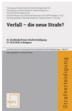
Verfall - die neue Strafe? Ladenpreis: 58,00EUR

Wir haben andere Produkte gefunden, die Ihnen gefallen könnten!