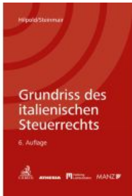
Grundriss des italienischen Steuerrechts Ladenpreis: 79,00EUR