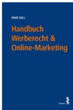
Handbuch Werberecht & Online-Marketing Ladenpreis: 65,00EUR