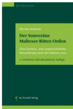
Der Souveräne Malteser-Ritter-Orden Ladenpreis: 59,90EUR