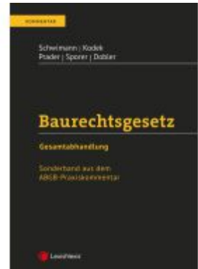
Baurechtsgesetz Ladenpreis: 82,00EUR