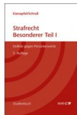
Strafrecht - Besonderer Teil I