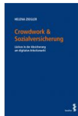
Crowdwork & Sozialversicherung Ladenpreis: 24,00EUR