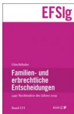
Familien- und erbrechtliche Entscheidungen EF-Slg