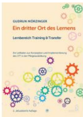
Ein dritter Ort des Lernens: Lernbereich Training & Transfer Ladenpreis: 24,90EUR