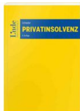
Privatsolvenz Ladenpreis: 52,00EUR