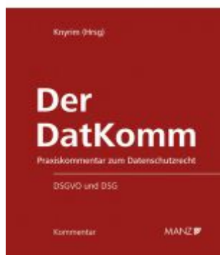
Der DatKomm Ladenpreis: 248,00EUR