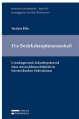
Die Bezirkshauptmannschaft Ladenpreis: 59,00EUR