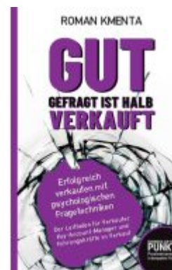
Gut gefragt ist halb verkauft Ladenpreis: 19,97EUR