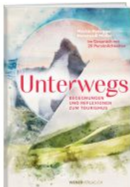
Unterwegs Ladenpreis: 49,00EUR