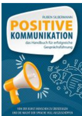
Positive Kommunikation - das Handbuch für erfolgreiche Gesprächsführung Ladenpreis: 16,40EUR