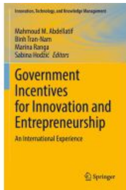
Government Incentives for Innovation and Entrepreneurship Ladenpreis: 186,99EUR