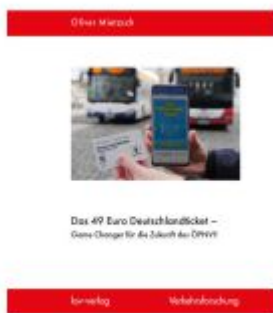
Das 49 Euro Deutschlandticket - Game Changer für die Zukunft des ÖPNV? Ladenpreis: 35,00EUR