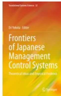
Frontiers of Japanese Management Control Systems Ladenpreis: 175,99EUR