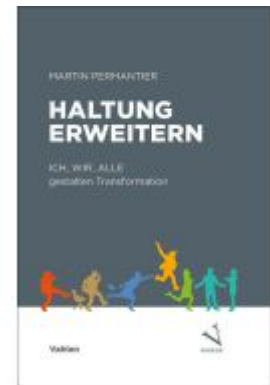
Haltung erweitern Ladenpreis: 35,90EUR