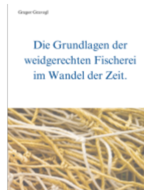
Die Grundlagen der weidgerechten Fischerei im Wandel der Zeit Ladenpreis: 38,80EUR