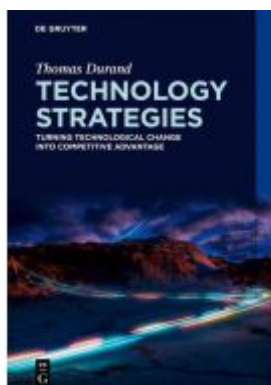
Technology Strategies Ladenpreis: 39,95EUR