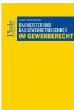
Baumeister und Baugewerbetreibender im Gewerberecht Ladenpreis: 44,00EUR