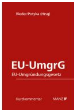
EU-Umgründungsgesetz Ladenpreis: 118,00EUR

Wir haben andere Produkte gefunden, die Ihnen gefallen könnten!