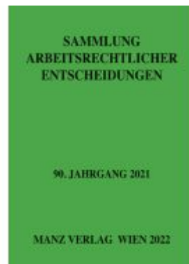
Sammlung arbeitsrechtlicher Entscheidungen Ladenpreis: 266,00EUR