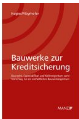
Bauwerke zur Kreditsicherung Ladenpreis: 54,00EUR