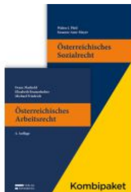
Kombipaket Österreichisches Arbeitsrecht und Österreichisches Sozialrecht Ladenpreis: 104,00EUR