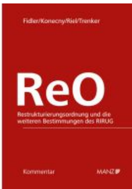
ReO - Restrukturierungsordnung und die weiteren Bestimmungen des RIRUG Ladenpreis: 128,00EUR