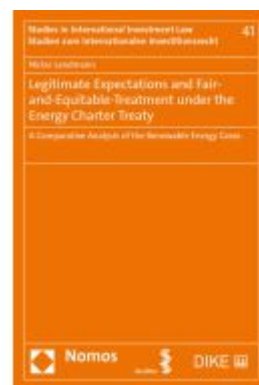
Legitimate Expectations and Fair-and- Equitable-Treatment under the Energy Charter Treaty Ladenpreis: 100,80EUR