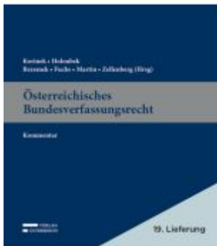
Österreichisches Bundesverfassungsrecht Ladenpreis: 529,00EUR