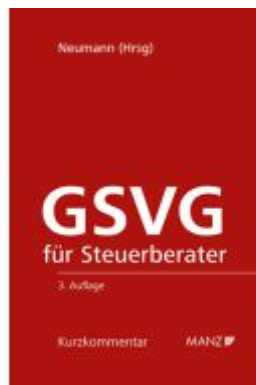
GSVG für Steuerberater Ladenpreis: 198,00EUR