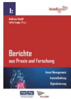
Berichte aus Praxis und Forschung - Asset Management. Instandhaltung. Digitalisierung. Ladenpreis: 79,90EUR