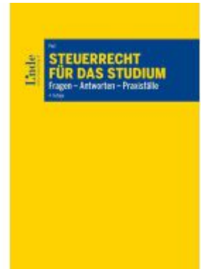
Steuerrecht für das Studium Ladenpreis: 45,00EUR