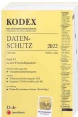
KODEX Datenschutz 2022 Ladenpreis: 65,00EUR