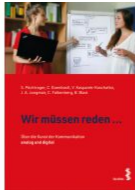
Wir müssen reden ... Ladenpreis: 9,90EUR