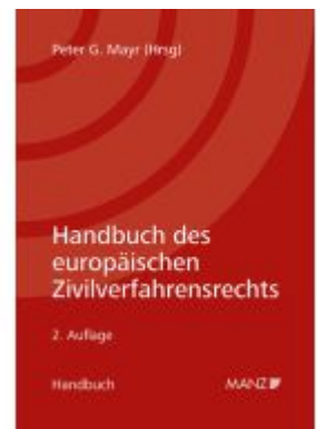
Handbuch des europäischen Zivilverfahrensrechts Ladenpreis: 268,00EUR