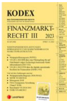
Kodex Finanzmarktrecht Band III 2023 Ladenpreis: 86,00EUR