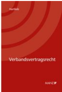
Verbandsvertragsrecht Ladenpreis: 138,00EUR