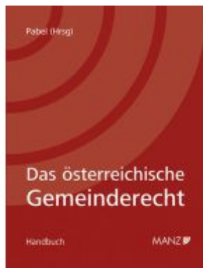
Das österreichische Gemeinderecht Ladenpreis: 198,00EUR