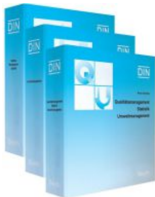
Qualitätsmanagement, Statistik, Umweltmanagement. Teil A, Teil B/C, Teil D und Teil E / Qualitätsmanagement - Statistik - Umweltmanagement. Teil A, Teil D und Teil E Ladenpreis: 450,30EUR