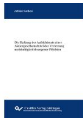
Die Haftung des Aufsichtsrats einer Aktiengesellschaft bei der Verletzung nachhaltigkeitsbezogener Pflichten Ladenpreis: 86,20EUR