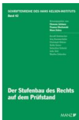
Der Stufenbau des Rechts auf dem Prüfstand Ladenpreis: 38,00EUR