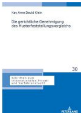
Die gerichtliche Genehmigung des Musterfeststellungsvergleichs Ladenpreis: 66,80EUR