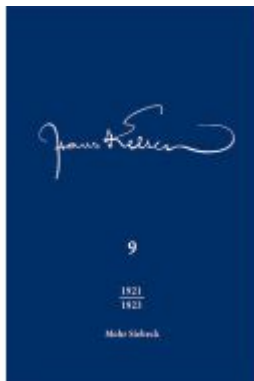
Hans Kelsen Werke Ladenpreis: 214,90EUR