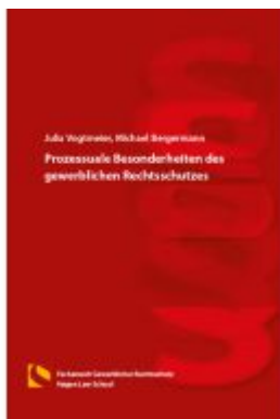
Prozessuale Besonderheiten des gewerblichen Rechtsschutzes Ladenpreis: 26,70EUR