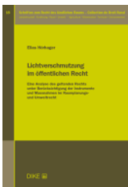
Lichtverschmutzung im öffentlichen Recht Ladenpreis: 102,00EUR