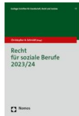
Recht für soziale Berufe 2023/24 Ladenpreis: 96,70EUR