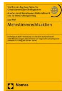
Mehrstimmrechtsaktien Ladenpreis: 132,70EUR