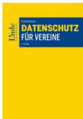
Datenschutz für Vereine Ladenpreis: 38,00EUR