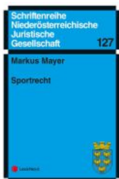
Sportrecht Ladenpreis: 11,00EUR