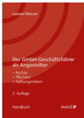
Der GmbH-Geschäftsführer als Angestellter Ladenpreis: 46,00EUR