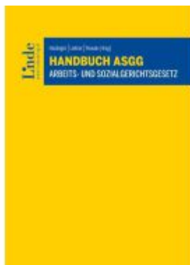
Handbuch ASGG | Arbeits- und Sozialgerichtsgesetz Ladenpreis: 59,00EUR

Wir haben andere Produkte gefunden, die Ihnen gefallen könnten!