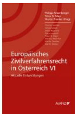
Europäisches Zivilverfahrensrecht in Österreich VI Ladenpreis: 52,00EUR