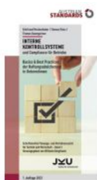
Interne Kontrollsysteme und Compliance für Betriebe Ladenpreis: 27,50EUR