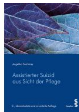
Assistierter Suizid aus Sicht der Pflege Ladenpreis: 26,90EUR