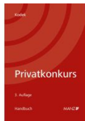
Handbuch Privatkonkurs Ladenpreis: 105,00EUR