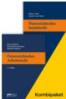
Kombipaket Österreichisches Arbeitsrecht und Österreichisches Sozialrecht Ladenpreis: 104,00EUR