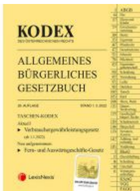
Taschen-Kodex ABGB 2022 - inkl. App Ladenpreis: 19,00EUR