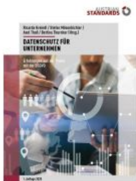
Datenschutz für Unternehmen Ladenpreis: 59,00EUR