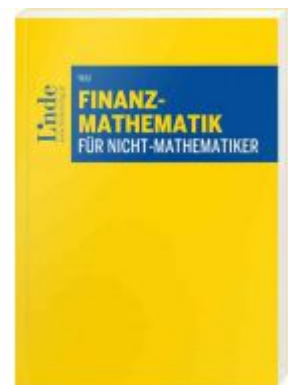
Finanzmathematik für Nicht-Mathematiker Ladenpreis: 42,00EUR