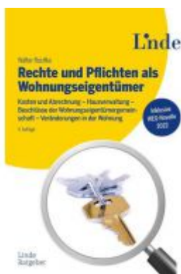
Rechte und Pflichten als Wohnungseigentümer Ladenpreis: 48,00EUR