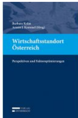
Wirtschaftsstandort Österreich Ladenpreis: 49,00EUR