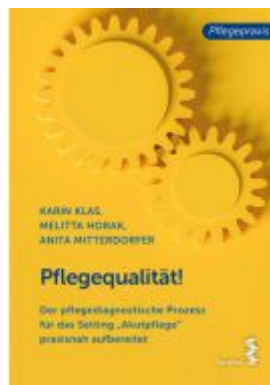
Pflegequalität! Ladenpreis: 9,90EUR