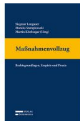
Maßnahmenvollzug Ladenpreis: 119,00EUR