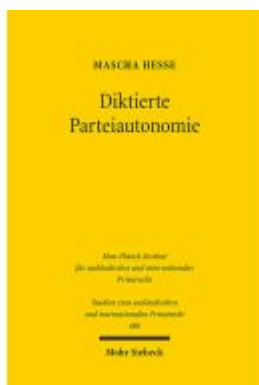
Diktierte Parteiautonomie Ladenpreis: 107,00EUR