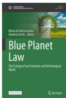
Blue Planet Law Ladenpreis: 54,99EUR