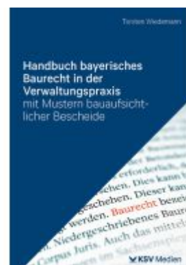
Handbuch bayerisches Baurecht in der Verwaltungspraxis Ladenpreis: 50,40EUR