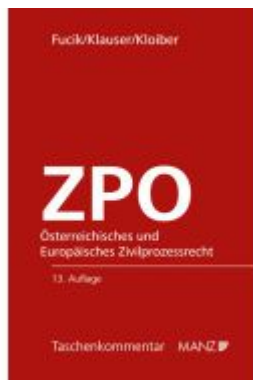
Österreichisches und Europäisches Zivilprozessrecht - ZPO Ladenpreis: 118,00EUR

Wir haben andere Produkte gefunden, die Ihnen gefallen könnten!