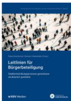
Leitlinien für Bürgerbeteiligung Ladenpreis: 20,60EUR