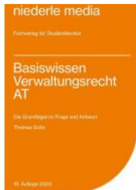
Basiswissen Verwaltungsrecht AT - 2023 Ladenpreis: 10,20EUR