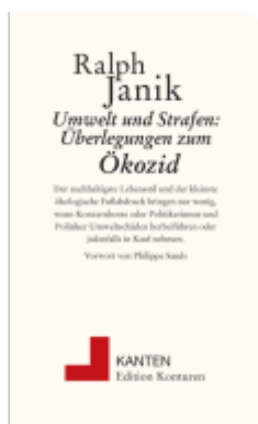
Umwelt und Strafe: Überlegungen zum Ökozid Ladenpreis: 12,00EUR