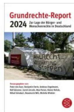
Grundrechte-Report 2024 Ladenpreis: 14,40EUR