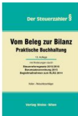
Vom Beleg zur Bilanz Ladenpreis: 64,90 EUR