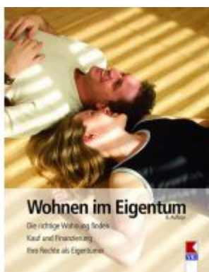
Wohnen im Eigentum Ladenpreis: 19,90 EUR