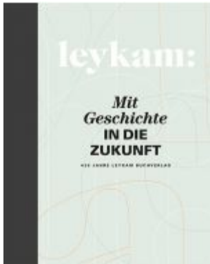
Leykam – Mit Geschichte in die Zukunft Ladenpreis: 24,90 EUR