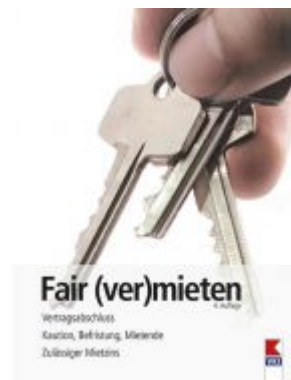
Fair (ver)mieten Ladenpreis: 19,90 EUR