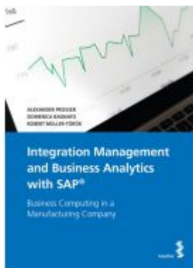
Integration Management and Business Analytics with SAP® Ladenpreis: 35,00 EUR

Wir haben andere Produkte gefunden, die Ihnen gefallen könnten!