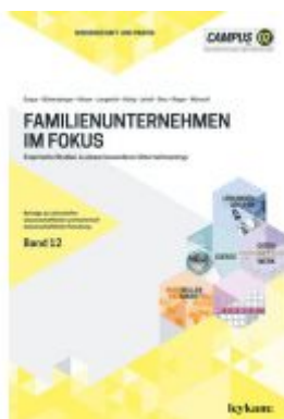
Familienunternehmen im Fokus. Empirische Studien zu einem besonderen Unternehmenstyp Ladenpreis: 17,00 EUR