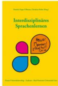
Interdisziplinäres Sprachenlernen Ladenpreis: 19,90 EUR