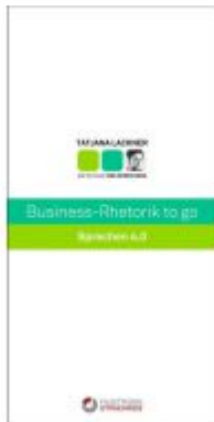
Business-Rhetorik to go Ladenpreis: 19,80 EUR