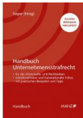
Handbuch Unternehmensstrafrecht Ladenpreis: 118,00 EUR