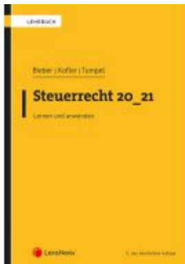
Steuerrecht 20_21 Ladenpreis: 69,00 EUR

Wir haben andere Produkte gefunden, die Ihnen gefallen könnten!