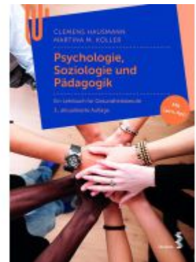
Psychologie, Soziologie und Pädagogik Ladenpreis: 24,90 EUR