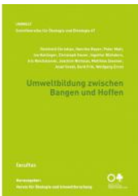
Umweltbildung zwischen Bangen und Hoffen Ladenpreis: 16,90 EUR