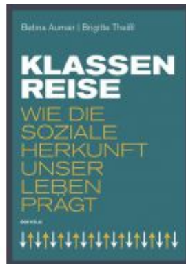
Klassenreise Ladenpreis: 19,90 EUR