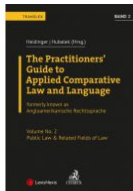
Angloamerikanische Rechtssprache / The Practitioners' Guide to Applied Comparative Law and Language Vol 2 Ladenpreis: 84,00 EUR