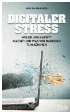
Digitaler Stress Ladenpreis: 24,90 EUR