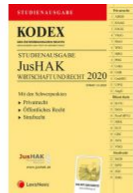
KODEX JusHAK Ladenpreis: 23,00 EUR