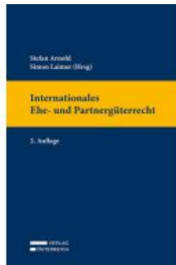
Internationales Ehe- und Partnergüterrecht Ladenpreis: 139,00EUR