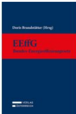
EEffG - Bundes-Energieeffizienzgesetz Ladenpreis: 89,00EUR

Wir haben andere Produkte gefunden, die Ihnen gefallen könnten!