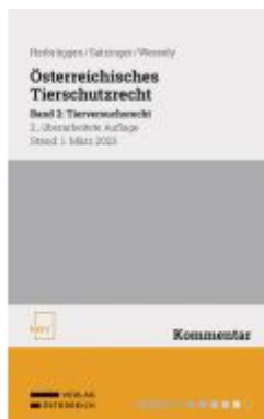
Österreichisches Tierschutzrecht Ladenpreis: 88,00EUR