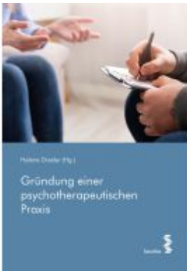
Gründung einer psychotherapeutischen Praxis Ladenpreis: 24,90EUR