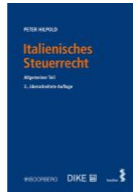
Italienisches Steuerrecht Ladenpreis: 46,00EUR