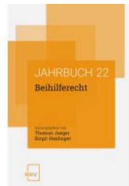
Beihilferecht Ladenpreis: 88,00EUR