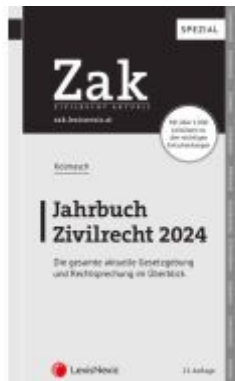
Zak Jahrbuch Zivilrecht 2024 Ladenpreis: 54,00EUR