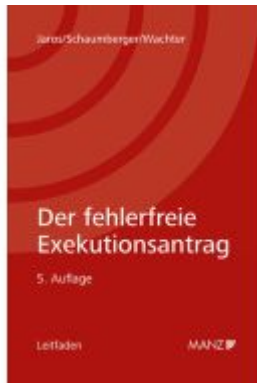
Der fehlerfreie Exekutionsantrag Ladenpreis: 56,00EUR