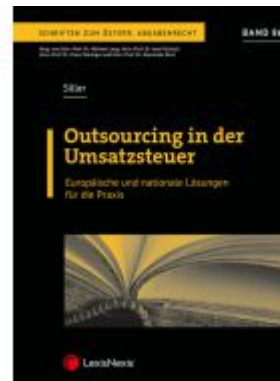
Outsourcing in der Umsatzsteuer Ladenpreis: 82,00EUR