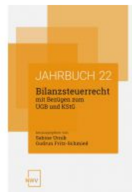
Bilanzsteuerrecht mit Bezügen zum UGB und KStG Ladenpreis: 62,00EUR