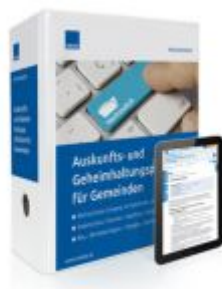
Auskunfts- und Geheimhaltungspflichten für Gemeinden Ladenpreis: 217,80EUR