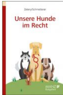
Unsere Hunde im Recht Ladenpreis: 23,80EUR