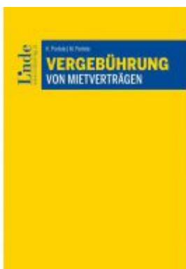
Vergebührung von Mietverträgen Ladenpreis: 25,00EUR