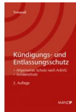
Kündigungs- und Entlassungsschutz Ladenpreis: 42,00EUR