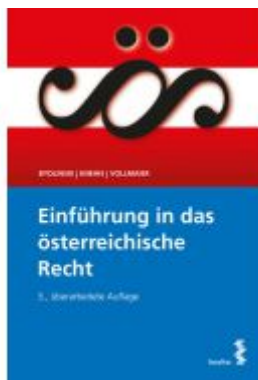
Einführung in das österreichische Recht Ladenpreis: 25,00EUR