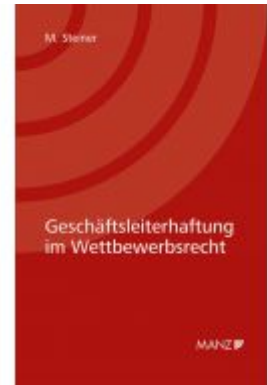
Geschäftsleiterhaftung im Wettbewerbsrecht Ladenpreis: 58,00EUR