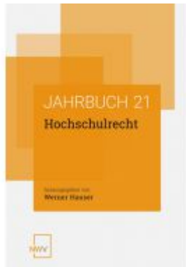
Hochschulrecht Ladenpreis: 68,00EUR