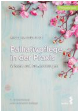
Palliativpflege in der Praxis Ladenpreis: 24,90EUR