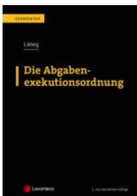
Die Abgabenexekutionsordnung Ladenpreis: 75,00EUR