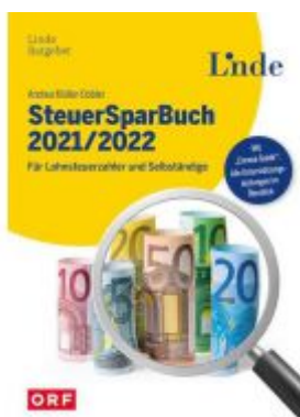
SteuerSparBuch 2021/2022 Ladenpreis: 29,90EUR