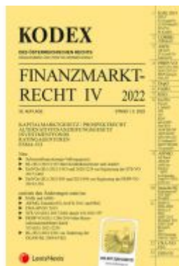
KODEX Finanzmarktrecht Band IV 2022 Ladenpreis: 81,00EUR