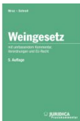
Weingesetz 5.Auflage Ladenpreis: 150,00EUR