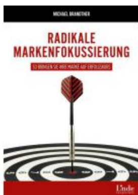
Radikale Markenfokussierung Ladenpreis: 29,90EUR