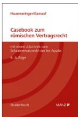
Casebook zum römischen Vertragsrecht Ladenpreis: 44,40EUR