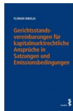
Gerichtsstandsvereinbarungen für kapitalmarktrechtliche Ansprüche in Satzungen und Emissionsbedingungen Ladenpreis: 38,00EUR