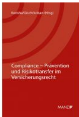
Compliance - Prävention und Risikotransfer im Versicherungsrecht 7. Kremser Versicherungsforum 2021 Ladenpreis: 36,00EUR

Wir haben andere Produkte gefunden, die Ihnen gefallen könnten!