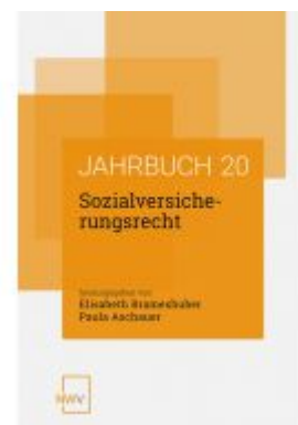
Sozialversicherungsrecht Ladenpreis: 62,00EUR