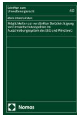
Möglichkeiten zur verstärkten Berücksichtigung von Umweltschutzaspekten im Ausschreibungssystem des EEG und WindSeeG Ladenpreis: 91,50EUR