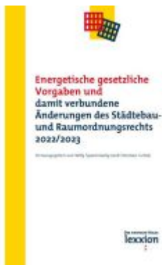
Energetische gesetzliche Vorgaben und damit verbundene Änderungen des Städtebau- und Raumordnungsrecht 2022/2023 Ladenpreis: 39,10EUR