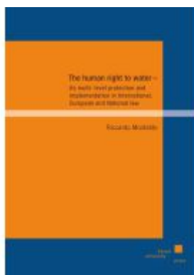
The human right to water - its multi-level protection and implementation in International, European and National law Ladenpreis: 40,10EUR