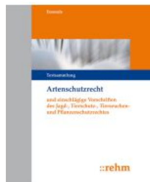
Artenschutzrecht (ArtSchR) Ladenpreis: 552,10EUR