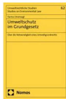
Umweltschutz im Grundgesetz Ladenpreis: 132,70EUR