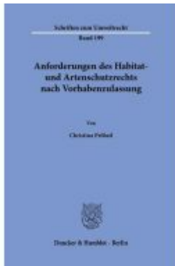
Anforderungen des Habitat- und Artenschutzrechts nach Vorhabenzulassung. Ladenpreis: 92,50EUR