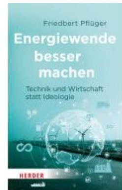
Energiewende besser machen Ladenpreis: 22,70EUR