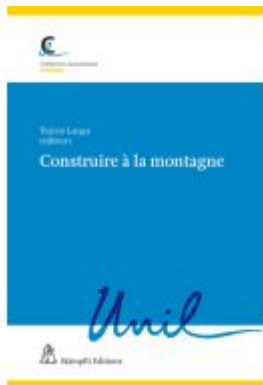
Construire à la montagne Ladenpreis: 93,00EUR