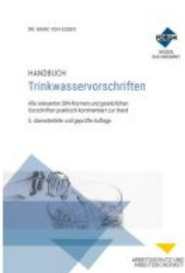
Handbuch Trinkwasservorschriften Ladenpreis: 132,70EUR