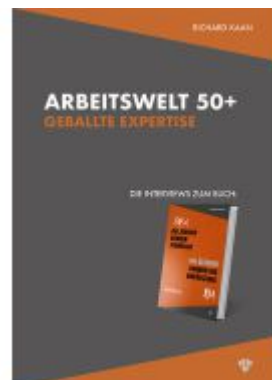
Arbeitswelt 50+: Geballte Expertise – Die Interviews Ladenpreis: 28,00EUR