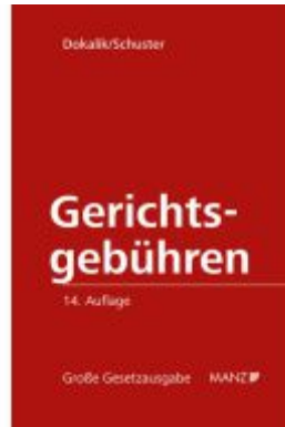
Gerichtsgebühren Ladenpreis: 160,00EUR