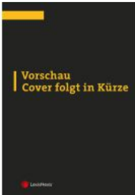
BAO Bundesabgabenordnung – Stoll Kommentar Band 1 Aktionspreis: 96,00EUR Ladenpreis: 120,00EUR