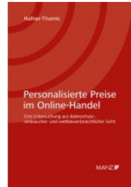
Personalisierte Preise im Online-Handel Ladenpreis: 86,00EUR