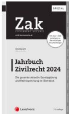
Zak Jahrbuch Zivilrecht 2024 Ladenpreis: 54,00EUR