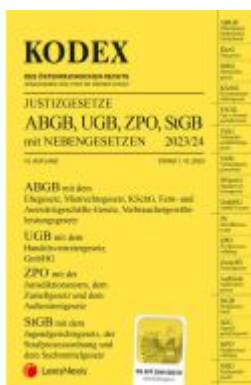
KODEX Justizgesetze 2023/24 - inkl. App Ladenpreis: 34,00EUR