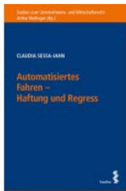
Automatisiertes Fahren – Haftung und Regress Ladenpreis: 52,00EUR