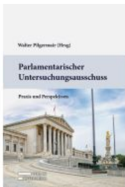
Parlamentarischer Untersuchungsausschuss Ladenpreis: 89,00EUR