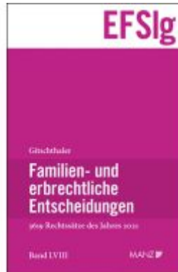
Familien- und erbrechtliche Entscheidungen EF-Slg Ladenpreis: 252,00EUR