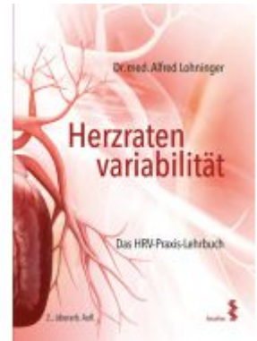
Herzratenvariabilität Ladenpreis: 48,00EUR