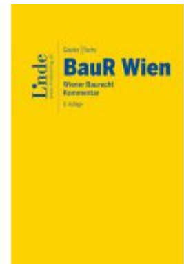
BauR Wien | Wiener Baurecht Ladenpreis: 120,00EUR