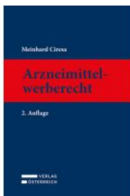
Arzneimittelwerberecht Ladenpreis: 169,00EUR