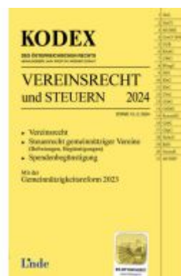
KODEX Vereinsrecht und Steuern Ladenpreis: 26,00EUR