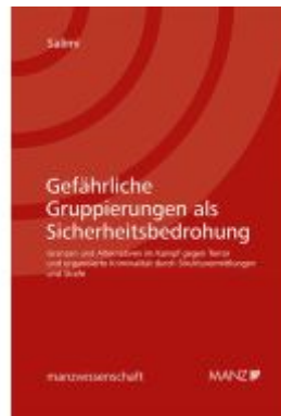
Gefährliche Gruppierungen als Sicherheitsbedrohung Ladenpreis: 118,00EUR