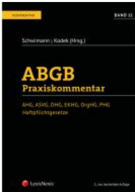
ABGB Praxiskommentar / ABGB Praxiskommentar - Band 11, 5. Auflage Ladenpreis: 164,00EUR