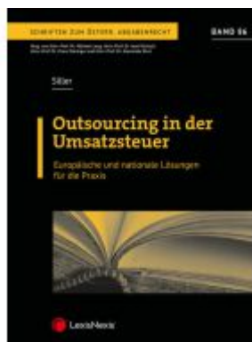
Outsourcing in der Umsatzsteuer Ladenpreis: 82,00EUR