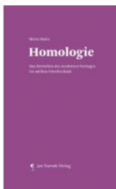
Homologie Ladenpreis: 34,90EUR