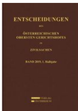
Entscheidungen des Obersten Gerichtshofes in Zivilsachen Ladenpreis: 198,00 EUR