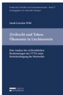
Zivilrecht und Token-Ökonomie in Liechtenstein Ladenpreis: 39,00 EUR