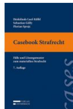
Casebook Strafrecht Ladenpreis: 36,00 EUR