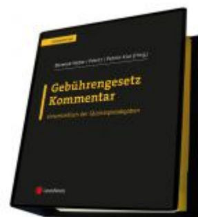
Gebührengesetz Kommentar Ladenpreis: 198,00 EUR