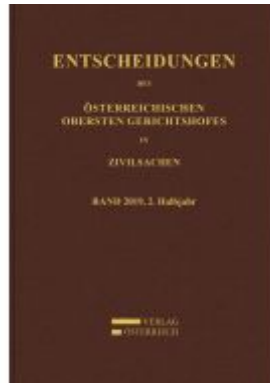
Entscheidungen des Obersten Gerichtshofes in Zivilsachen Ladenpreis: 168,00 EUR