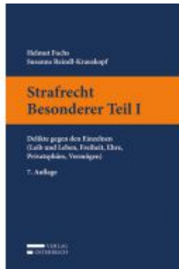
Strafrecht Besonderer Teil I Ladenpreis: 35,00 EUR