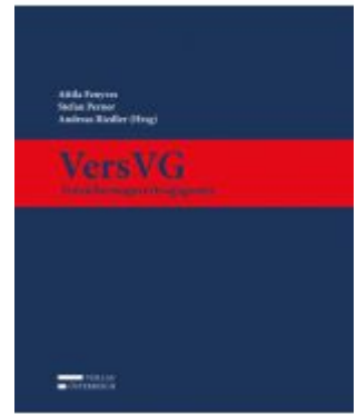
VersVG - Versicherungsvertragsgesetz Ladenpreis: 259,00 EUR