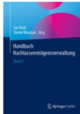
Handbuch Nachlassvermögensverwaltung Ladenpreis: 56,53EUR