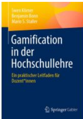
Gamification in der Hochschullehre Ladenpreis: 28,77EUR