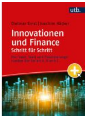
Innovationen und Finance Schritt für Schritt Ladenpreis: 28,70EUR