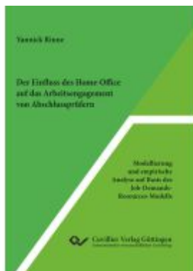
Der Einfluss des Home-Office auf das Arbeitsengagement von Abschlussprüfern Ladenpreis: 78,10EUR