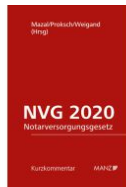
Notarversorgungsgesetz - NVG 2020 Ladenpreis: 89,00EUR