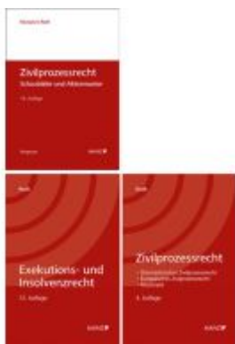
PAKET: Zivilprozessrecht 4.Auflage+ Zivilprozessrecht Schaubilder und Aktenmuster 14.Auflage+ Exekutions-und InsolvenzR 12.Auflage Ladenpreis: 124,20EUR