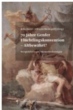
70 Jahre Genfer Flüchtlingskonvention - Altbewährt? Ladenpreis: 65,00EUR

Wir haben andere Produkte gefunden, die Ihnen gefallen könnten!