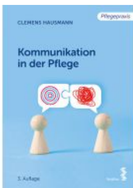
Kommunikation in der Pflege Ladenpreis: 19,90EUR