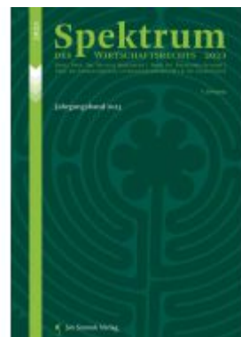
Spektrum des Wirtschaftsrechts Ladenpreis: 42,50EUR