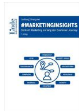
#marketinginsights Ladenpreis: 39,00EUR