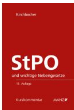
Strafprozessordnung - StPO Ladenpreis: 190,00EUR