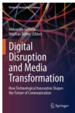
Digital Disruption and Media Transformation Ladenpreis: 76,99EUR