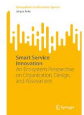
Smart Service Innovation Ladenpreis: 43,99EUR