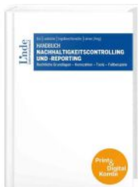
Handbuch Nachhaltigkeitscontrolling und - reporting (Kombi Print&digital) Ladenpreis: 119,00EUR