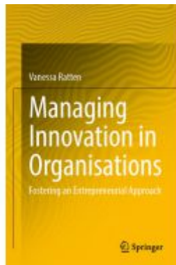
Managing Innovation in Organisations Ladenpreis: 71,49EUR