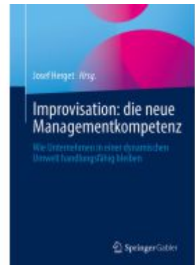
Improvisation: die neue Managementkompetenz Ladenpreis: 46,25EUR