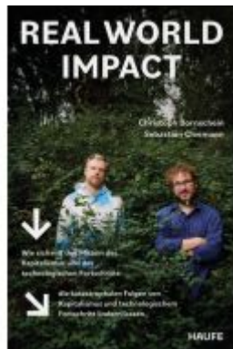
Real World Impact Ladenpreis: 22,70EUR

Wir haben andere Produkte gefunden, die Ihnen gefallen könnten!