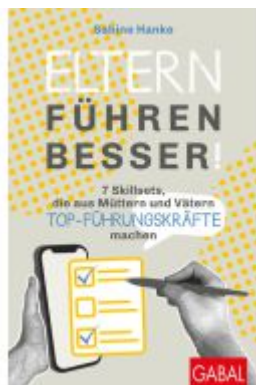
Eltern führen besser! Ladenpreis: 25,80EUR