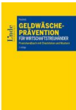
Geldwäscheprävention für Wirtschaftstreuhandler Ladenpreis: 34,00EUR