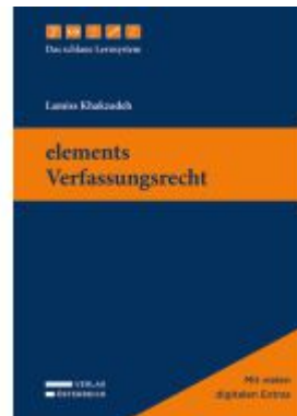
elements Verfassungsrecht Ladenpreis: 49,00EUR