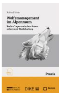
Wolfsmanagement im Alpenraum Ladenpreis: 79,00EUR