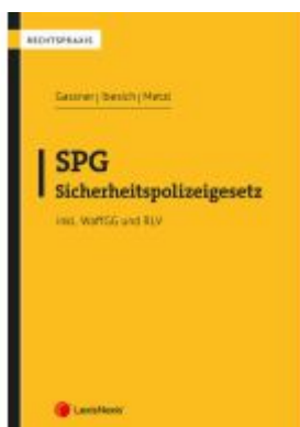
SPG - Sicherheitspolizeigesetz Ladenpreis: 39,00EUR