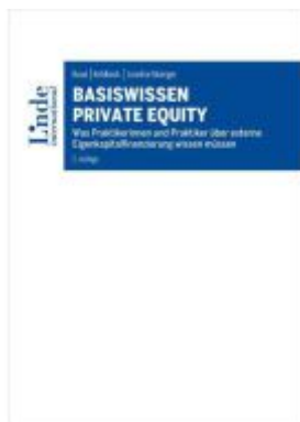
Basiswissen Private Equity Ladenpreis: 42,00EUR