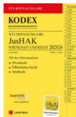
KODEX JusHAK 2023/24 - inkl. App Ladenpreis: 23,00EUR