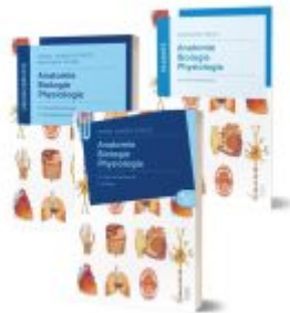
Lernpaket Anatomie, Biologie, Physiologie II Ladenpreis: 66,90EUR