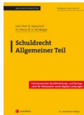
Schuldrecht Allgemeiner Teil (Skriptum) Ladenpreis: 22,50EUR