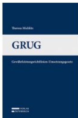
GRUG Ladenpreis: 39,00EUR