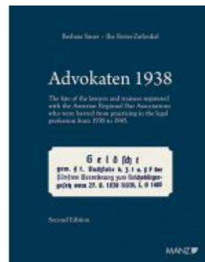
Advokaten 1938 English edition Ladenpreis: 78,00EUR