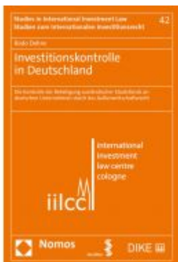
Investitionskontrolle in Deutschland Ladenpreis: 184,10EUR

Wir haben andere Produkte gefunden, die Ihnen gefallen könnten!