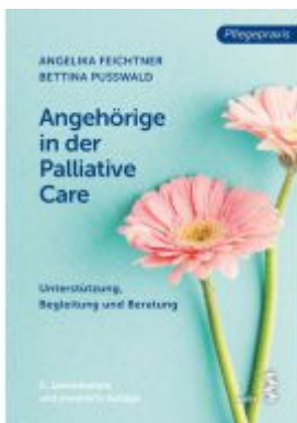
Angehörige in der Palliative Care Ladenpreis: 24,90EUR