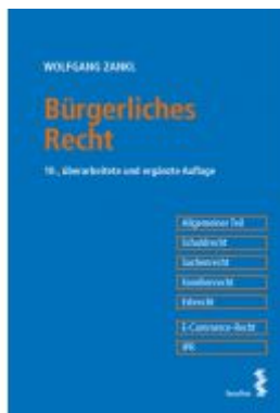
Bürgerliches Recht Ladenpreis: 49,00EUR