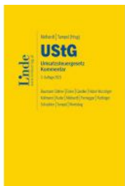
UStG | Umsatzsteuergesetz Ladenpreis: 330,00EUR