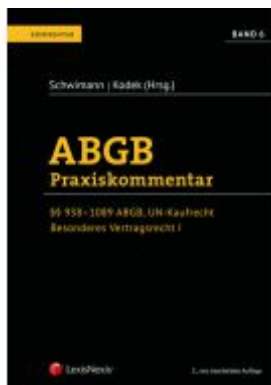
ABGB Praxiskommentar / ABGB Praxiskommentar - Band 6, 5. Auflage Ladenpreis: 219,00EUR