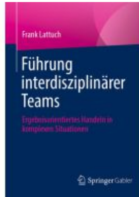
Führung interdisziplinärer Teams Ladenpreis: 35,97EUR