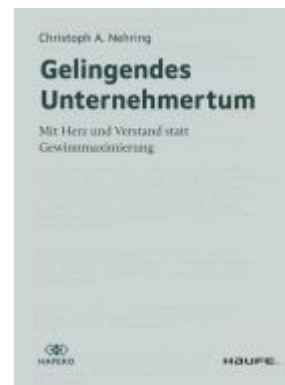
Gelingendes Unternehmertum Ladenpreis: 30,90EUR