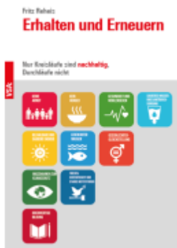
Erhalten und Erneuern Ladenpreis: 13,20EUR

Wir haben andere Produkte gefunden, die Ihnen gefallen könnten!