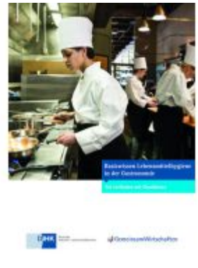
Basiswissen Lebensmittelhygiene in der Gastronomie Ladenpreis: 7,20EUR