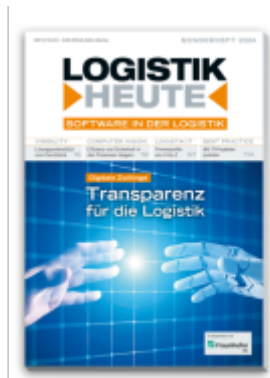
Software in der Logistik 2024 Ladenpreis: 32,80EUR