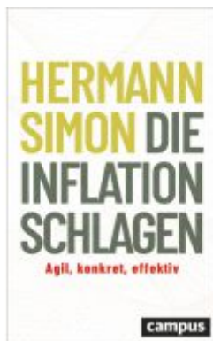
Die Inflation schlagen Ladenpreis: 30,90EUR