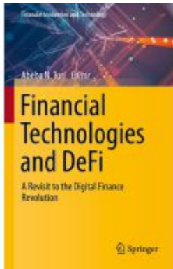
Financial Technologies and DeFi Ladenpreis: 98,99EUR