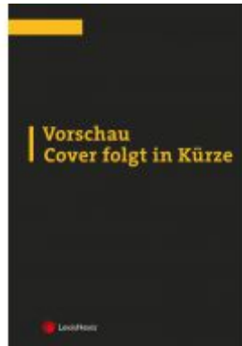
ABGB Praxiskommentar / IPR Praxiskommentar Aktionspreis: 196,00EUR Ladenpreis: 245,00EUR