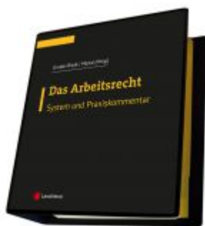
Das Arbeitsrecht - System und Praxiskommentar Ladenpreis: 325,00EUR

Wir haben andere Produkte gefunden, die Ihnen gefallen könnten!