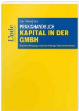
Praxishandbuch Kapital in der GmbH Ladenpreis: 55,00EUR