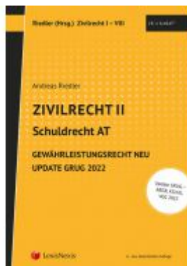
Zivilrecht II - Update GRUG 2022 Ladenpreis: 5,00EUR