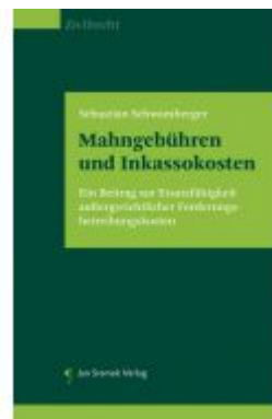
Mahngebühren und Inkassokosten Ladenpreis: 59,90EUR