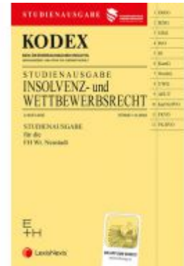
KODEX Insolvenz- und Wettbewerbsrecht 2022 - inkl. App Ladenpreis: 19,00EUR