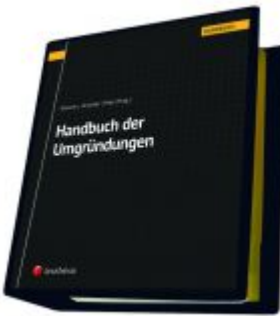
Handbuch der Umgründungen Ladenpreis: 450,00EUR