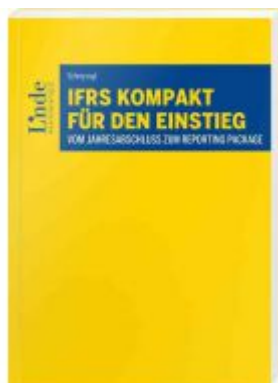
IFRS kompakt für den Einstieg Ladenpreis: 28,00EUR