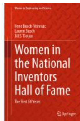
Women in the National Inventors Hall of Fame Ladenpreis: 131,99EUR