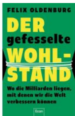
Der gefesselte Wohlstand Ladenpreis: 25,70EUR