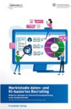
Marktstudie daten- und KI-basiertes Recruiting Ladenpreis: 71,00EUR