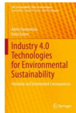
Industry 4.0 Technologies for Environmental Sustainability Ladenpreis: 131,99EUR