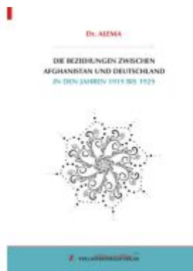
Die Beziehungen zwischen Afghanistan und Deutschland in den Jahren 1919 bis 1929 Ladenpreis: 39,80EUR