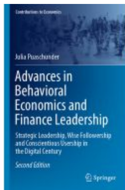
Advances in Behavioral Economics and Finance Leadership Ladenpreis: 131,99EUR