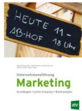
Unternehmensführung Marketing Ladenpreis: 15,59EUR