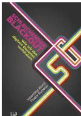
Schleichender Blackout Ladenpreis: 19,50EUR