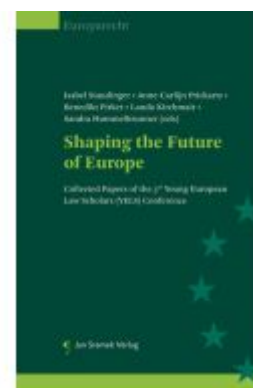
Shaping the Future of Europe Ladenpreis: 74,00EUR