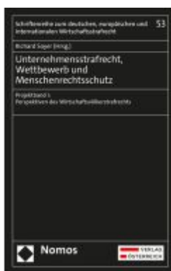
Unternehmensstrafrecht, Wettbewerb und Menschenrechtsschutz Ladenpreis: 249,00EUR