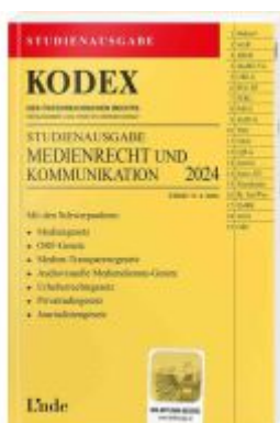
KODEX Studienausgabe Medienrecht und Kommunikation Ladenpreis: 15,00EUR