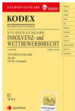
KODEX Insolvenz- und Wettbewerbsrecht 2022 - inkl. App Ladenpreis: 19,00EUR

Wir haben andere Produkte gefunden, die Ihnen gefallen könnten!