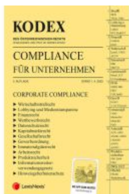
KODEX Compliance für Unternehmen 2023 - inkl. App Ladenpreis: 79,00EUR