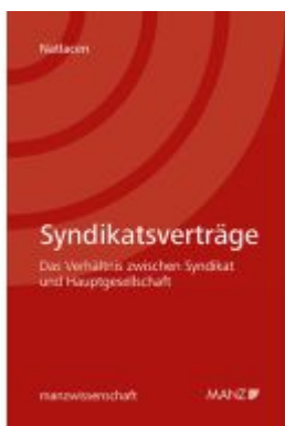
Syndikatsverträge - Das Verhältnis zwischen Syndikat und Hauptgesellschaft Ladenpreis: 64,00EUR