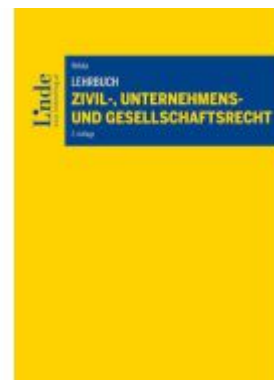
Lehrbuch Zivil-, Unternehmens- und Gesellschaftsrecht Ladenpreis: 55,00EUR