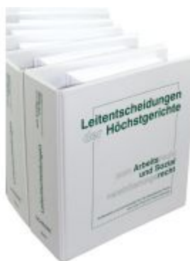
Leitentscheidungen der Höchstgerichte zum Arbeitsrecht und Sozialversicherungsrecht Ladenpreis: 1.360,00EUR