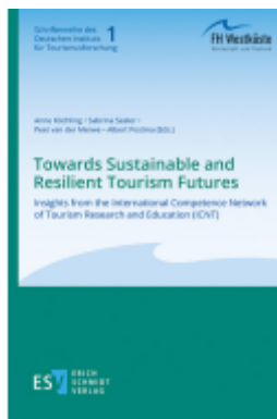
Towards Sustainable and Resilient Tourism Futures Ladenpreis: 51,40EUR