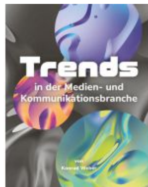
Trends in der Medien- und Kommunikationsbranche Ladenpreis: 25,00EUR