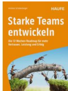
Starke Teams entwickeln Ladenpreis: 41,20EUR