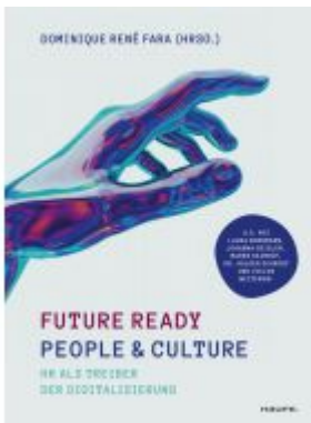
Future ready People & Culture Ladenpreis: 51,40EUR

Wir haben andere Produkte gefunden, die Ihnen gefallen könnten!