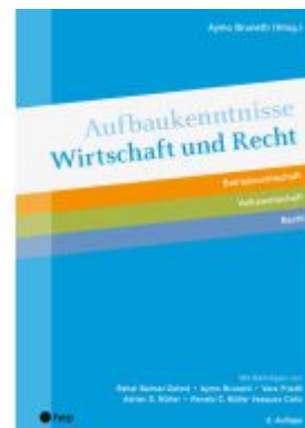
Aufbaukenntnisse Wirtschaft und Recht Ladenpreis: 34,00EUR