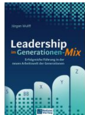
Leadership im Generationen-Mix Ladenpreis: 20,60EUR