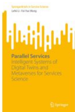
Parallel Services Ladenpreis: 54,99EUR