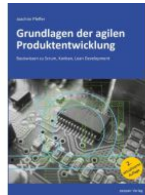
Grundlagen der agilen Produktentwicklung Ladenpreis: 12,40EUR