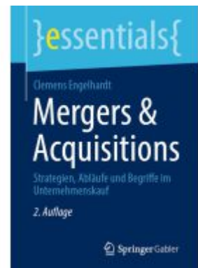
Mergers & Acquisitions Ladenpreis: 15,41EUR