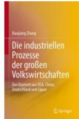
Die industriellen Prozesse der großen Volkswirtschaften Ladenpreis: 102,79EUR