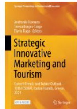
Strategic Innovative Marketing and Tourism Ladenpreis: 54,99EUR