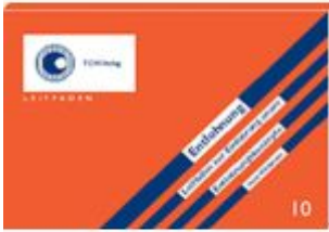
Entlohnung Ladenpreis: 233,64EUR