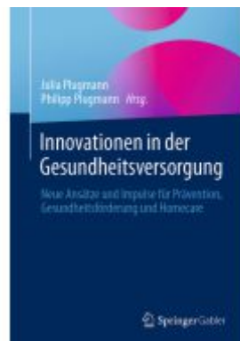
Innovationen in der Gesundheitsversorgung Ladenpreis: 66,81EUR