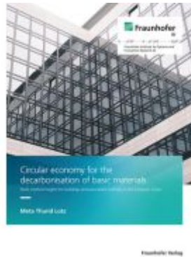
Circular economy for the decarbonisation of basic materials Ladenpreis: 68,90EUR