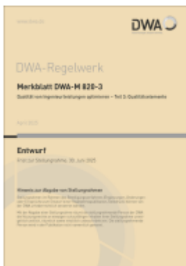
Merkblatt DWA-M 820-3 Qualität von Ingenieurleistungen optimieren - Teil 3: Qualitätselemente (Entwurf) Ladenpreis: 72,00EUR