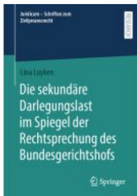
Die sekundäre Darlegungslast im Spiegel der Rechtsprechung des Bundesgerichtshofs Ladenpreis: 92,51EUR