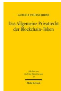
Das Allgemeine Privatrecht der Blockchain- Token Ladenpreis: 91,50EUR