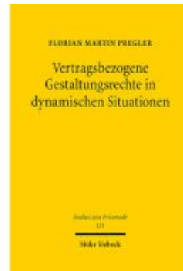
Vertragsbezogene Gestaltungsrechte in dynamischen Situationen Ladenpreis: 96,70EUR