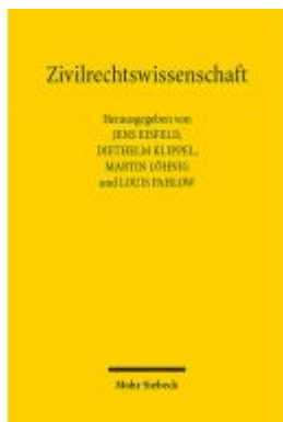
Zivilrechtswissenschaft Ladenpreis: 132,70EUR