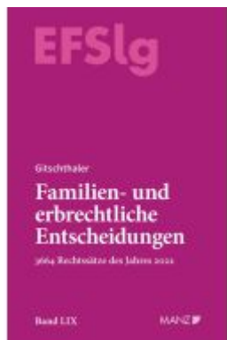
Familien- und erbrechtliche Entscheidungen EF-Slg Ladenpreis: 264,00EUR