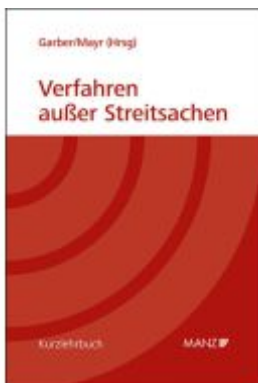
Verfahren außer Streitsachen Ladenpreis: 65,00EUR