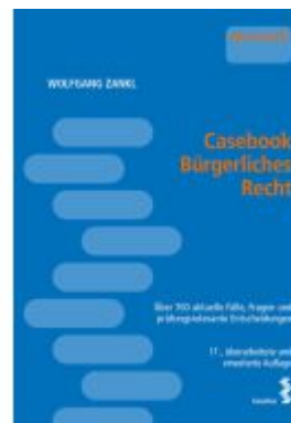
Casebook Bürgerliches Recht Ladenpreis: 48,00EUR