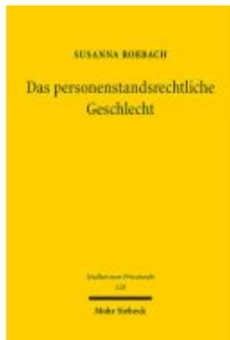
Das personenstandsrechtliche Geschlecht Ladenpreis: 86,40EUR