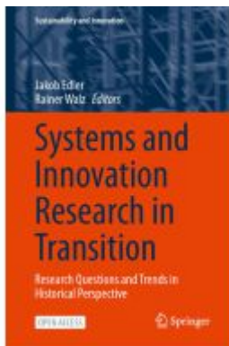
Systems and Innovation Research in Transition Ladenpreis: 54,99EUR