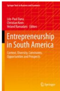
Entrepreneurship in South America Ladenpreis: 87,99EUR