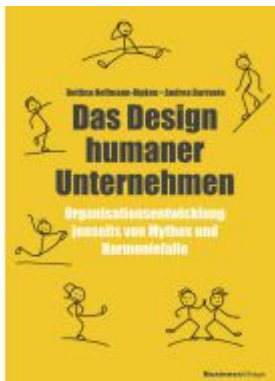
Das Design humaner Unternehmen Ladenpreis: 41,10EUR

Wir haben andere Produkte gefunden, die Ihnen gefallen könnten!