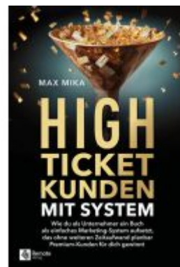
High-Ticket-Kunden mit System Ladenpreis: 31,99EUR