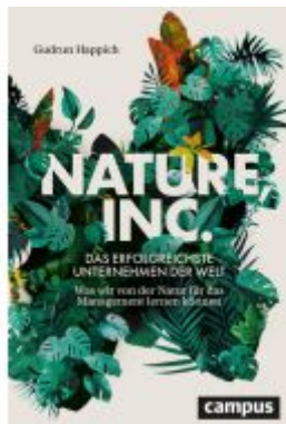
Nature, Inc. – das erfolgreichste Unternehmen der Welt Ladenpreis: 30,90EUR