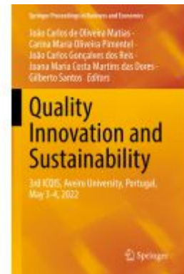
Quality Innovation and Sustainability Ladenpreis: 219,99EUR