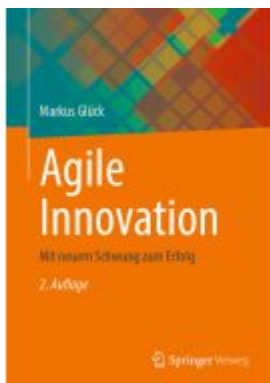
Agile Innovation Ladenpreis: 39,06EUR