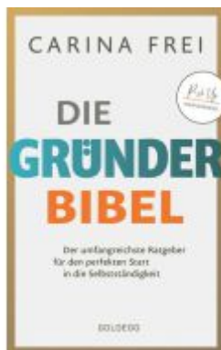
Gründerbibel Ladenpreis: 24,95EUR