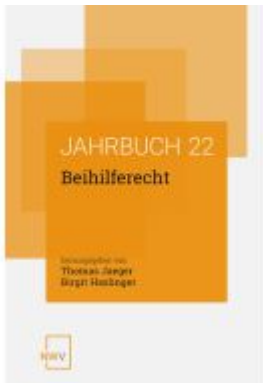
Beihilferecht Ladenpreis: 88,00EUR