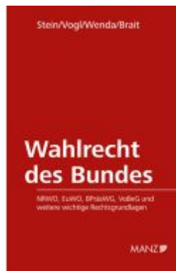
Wahlrecht des Bundes Ladenpreis: 138,00EUR