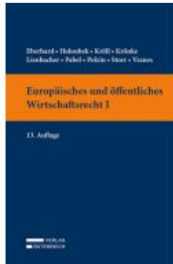
Europäisches und öffentliches Wirtschaftsrecht I Ladenpreis: 39,00EUR