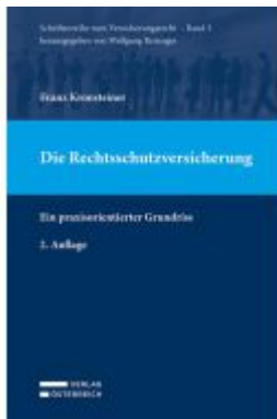
Die Rechtsschutzversicherung Ladenpreis: 69,00EUR

Wir haben andere Produkte gefunden, die Ihnen gefallen könnten!