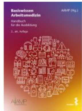
Basiswissen Arbeitsmedizin Ladenpreis: 94,00EUR