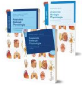
Lernpaket Anatomie, Biologie, Physiologie II Ladenpreis: 66,90EUR