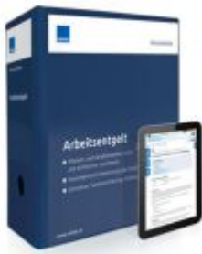
Arbeitsentgelt Ladenpreis: 239,80EUR