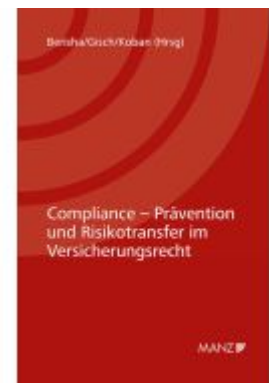
Compliance - Prävention und Risikotransfer im Versicherungsrecht 7. Kremser Versicherungsforum 2021 Ladenpreis: 36,00EUR