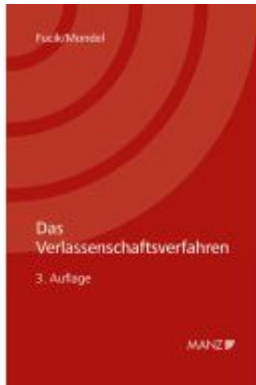
Das Verlassenschaftsverfahren Ladenpreis: 44,00EUR