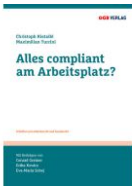
Alles compliant am Arbeitsplatz? Ladenpreis: 36,00EUR