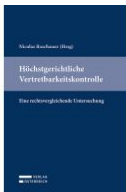
Höchstgerichtliche Vertretbarkeitskontrolle Ladenpreis: 49,00EUR