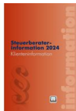
Steuerberaterinformation 2024 Ladenpreis: 52,00EUR