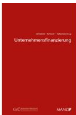
Unternehmensfinanzierung Ladenpreis: 44,00EUR