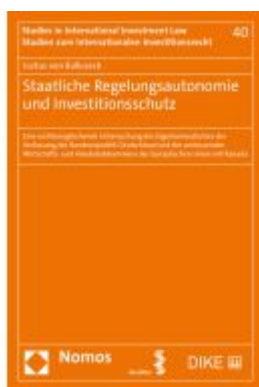
Staatliche Regelungsautonomie und Investitionsschutz Ladenpreis: 63,80EUR