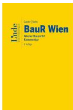
BauR Wien | Wiener Baurecht Ladenpreis: 120,00EUR