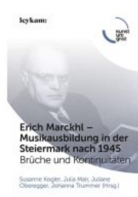
Erich Marckhl - Musikausbildung in der Steiermark nach 1945 Ladenpreis: 32,00EUR