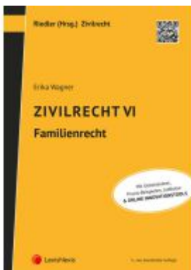
Zivilrecht VI - Familienrecht Ladenpreis: 37,00EUR

Wir haben andere Produkte gefunden, die Ihnen gefallen könnten!