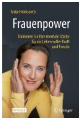
Frauenpower Ladenpreis: 23,63EUR

Wir haben andere Produkte gefunden, die Ihnen gefallen könnten!