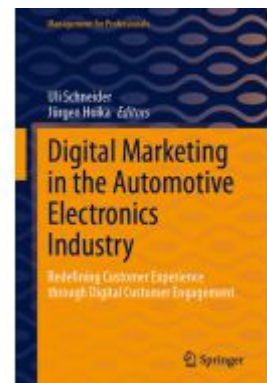
Digital Marketing in the Automotive Electronics Industry Ladenpreis: 93,49EUR