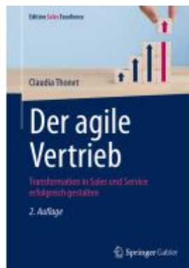
Der agile Vertrieb Ladenpreis: 56,53EUR