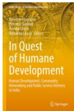
In Quest of Humane Development Ladenpreis: 164,99EUR