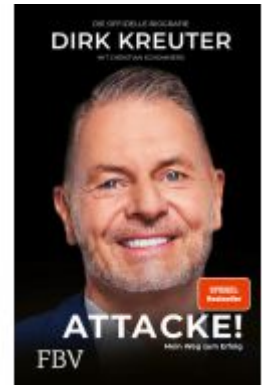
Dirk Kreuter - Attacke! Mein Weg zum Erfolg Ladenpreis: 20,60EUR