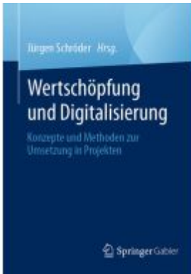
Wertschöpfung und Digitalisierung Ladenpreis: 46,25EUR