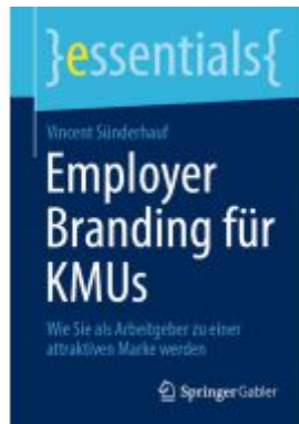
Employer Branding für KMUs Ladenpreis: 15,41EUR