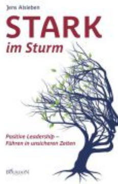
Stark im Sturm Ladenpreis: 25,60EUR