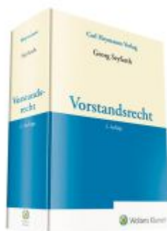
Vorstandsrecht Ladenpreis: 173,80EUR