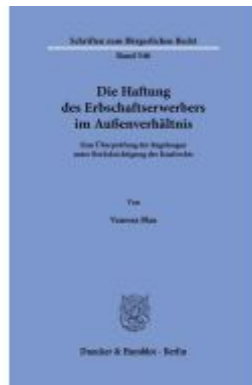
Die Haftung des Erbschaftserwerbers im Außenverhältnis. Ladenpreis: 61,60EUR