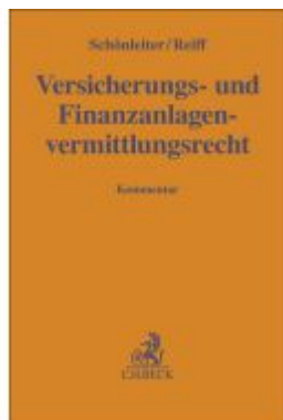
Versicherungs- und Finanzanlagenvermittlungsrecht Ladenpreis: 81,30EUR

Wir haben andere Produkte gefunden, die Ihnen gefallen könnten!