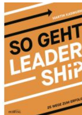
So geht Leadership Ladenpreis: 26,00EUR