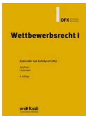
Wettbewerbsrecht I Kommentar Ladenpreis: 152,20EUR