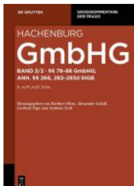
§§ 78-88; Anh. §§ 266, 283-283d StGB Ladenpreis: 119,95EUR