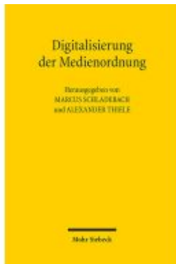
Digitalisierung der Medienordnung Ladenpreis: 50,40EUR