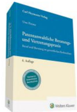
Patentanwaltliche Beratungs- und Vertretungspraxis Ladenpreis: 153,20EUR