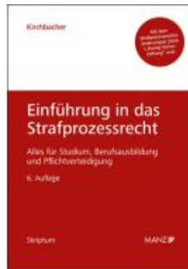
Einführung in das Strafprozessrecht Ladenpreis: 32,00EUR