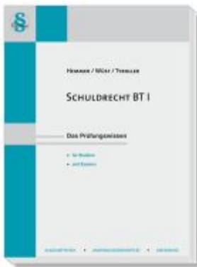
Schuldrecht BT I Ladenpreis: 25,60EUR