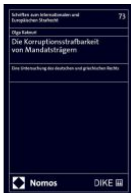
Die Korruptionstrafbarkeit von Mandatsträgern Ladenpreis: 137,80EUR