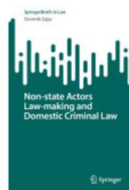
Non-state Actors Law-making and Domestic Criminal Law Ladenpreis: 43,99EUR