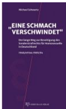
"Eine Schmach verschwindet" Ladenpreis: 16,50EUR