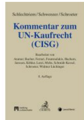
Kommentar zum UN-Kaufrecht Ladenpreis: 259,00EUR