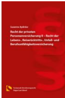
Recht der privaten Personenversicherung II – Recht der Lebens-, Reiserücktritts-, Unfall- und Berufsunfähigkeitsversicherung Ladenpreis: 25,70EUR