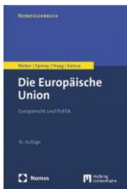
Die Europäische Union Ladenpreis: 53,00EUR