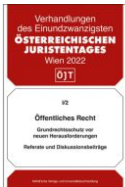
Öffentliches Recht Ladenpreis: 48,00EUR