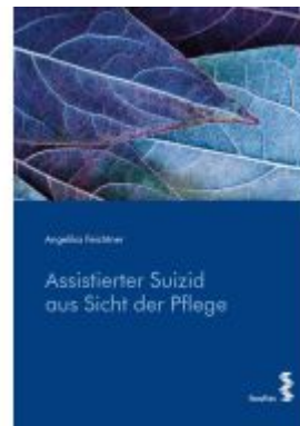
Assistierter Suizid aus Sicht der Pflege Ladenpreis: 19,90EUR