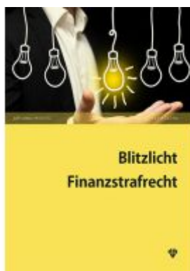
Blitzlicht Finanzstrafrecht Ladenpreis: 33,00EUR