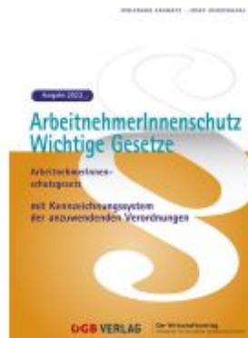
ArbeitnehmerInnenschutz. Ladenpreis: 72,80EUR