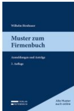
Muster zum Firmenbuch Ladenpreis: 69,00EUR