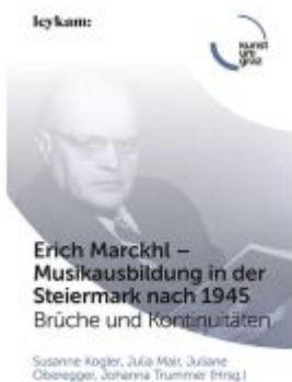
Erich Marckhl – Musikausbildung in der Steiermark nach 1945 Ladenpreis: 32,00EUR

Wir haben andere Produkte gefunden, die Ihnen gefallen könnten!