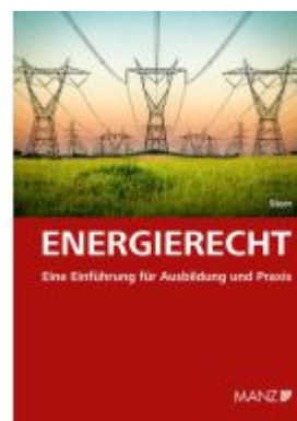
Energierrecht Eine Einführung für Ausbildung und Praxis Ladenpreis: 48,00EUR