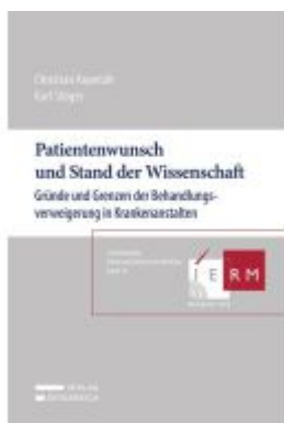
Patientenwunsch und Stand der Wissenschaft Ladenpreis: 49,00EUR