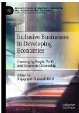
Inclusive Businesses in Developing Economies Ladenpreis: 186,99EUR