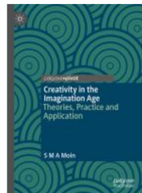
Creativity in the Imagination Age Ladenpreis: 49,49EUR