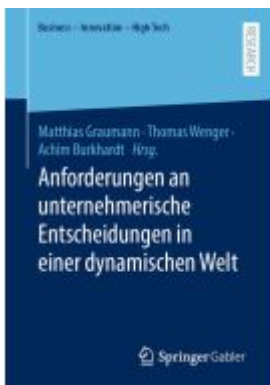
Anforderungen an unternehmerische Entscheidungen in einer dynamischen Welt Ladenpreis: 123,35EUR