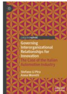
Governing Interorganizational Relationships for Innovation Ladenpreis: 38,49EUR