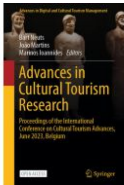
Advances in Cultural Tourism Research Ladenpreis: 54,99EUR