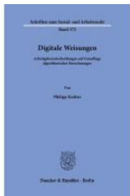
Digitale Weisungen. Ladenpreis: 92,50EUR