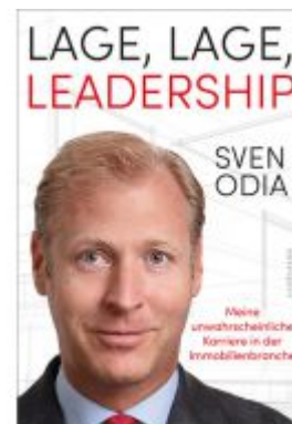
Lage, Lage, Leadership. Meine unwahrscheinliche Karriere in der Immobilienbranche. Ladenpreis: 24,70EUR