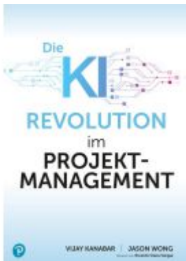
AI-Revolution im Projektmanagement Ladenpreis: 59,95EUR

Wir haben andere Produkte gefunden, die Ihnen gefallen könnten!