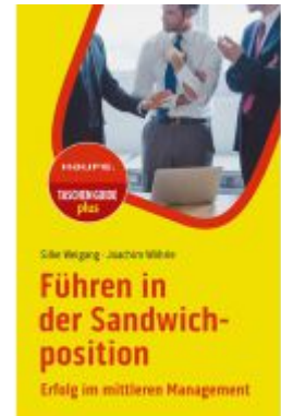
Führen in der Sandwichposition Ladenpreis: 15,50EUR