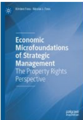
Economic Microfoundations of Strategic Management Ladenpreis: 120,99EUR