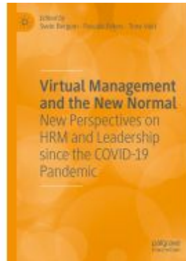
Virtual Management and the New Normal Ladenpreis: 197,99EUR