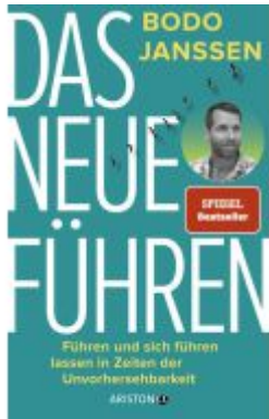
Das neue Führen Ladenpreis: 23,70EUR