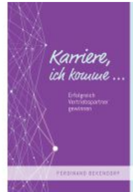
Karriere, ich komme... Ladenpreis: 30,90EUR