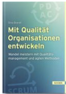
Mit Qualität Organisationen entwickeln Ladenpreis: 61,70EUR