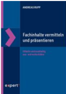
Fachinhalte vermitteln und präsentieren Ladenpreis: 41,00EUR